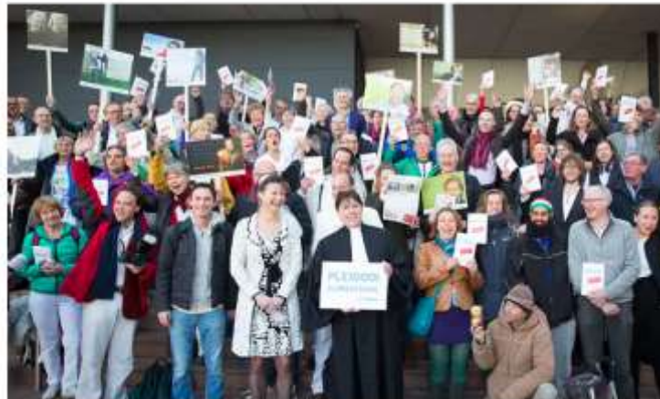
▲ Urgenda supporters celebrate at The Hague after court ruling requiring Dutch government to slash emissions.

Dutch court orders state to reduce emissions by 25% within five years to protect its citizens from climate change in world's first climate liability suit