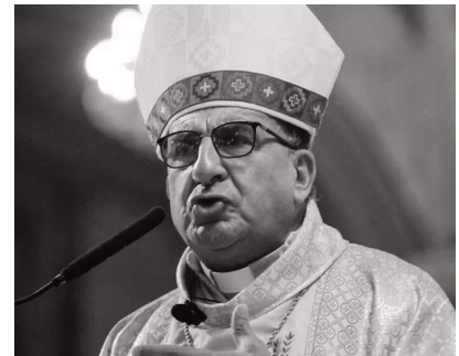
CARDENAL FERNANDO CHOMALI Arzobispo de Santiago

siendo el mismo, aunque los problemas y los temas que debe afrontar son cada vez más diversos y complejos. Un hombre de Dios se ha convertido en Jefe de Estado de la Ciudad del Vaticano y, lo quiera o no, sus actos tienen una dimensión política que no deja indiferente. Su mirada es teológica y comprende la realidad desde el prisma de la dignidad del ser humano. Conoce a fondo los principios de la Doctrina Social de la Iglesia en materia política. El Papa prefiere obedecer a Dios antes que a los hombres, como enseña el Maestro, y no se intimida ante los poderosos de la tierra, como él mismo los llama. Su lenguaje es claro y sin eufemismos, porque sabe que sus palabras son urgentes y han de ser la voz de los que no tienen voz.