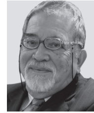
ABRAHAM SANTIBÁÑEZ Premio Nacional de Periodismo 2015

Un desafortunado chiste de la comedianta chilena, Natalia Valdebenito, sobre la tragedia de los mineros de El Teniente, terminó constituyéndose en un aleccionador episodio sobre los alcances de la libertad de expresión.